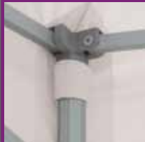
Bâche renforcée à chaque angle