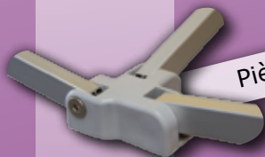
Pièce de connexion