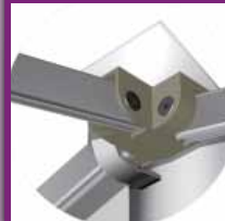
Renfort et attache au ciseau